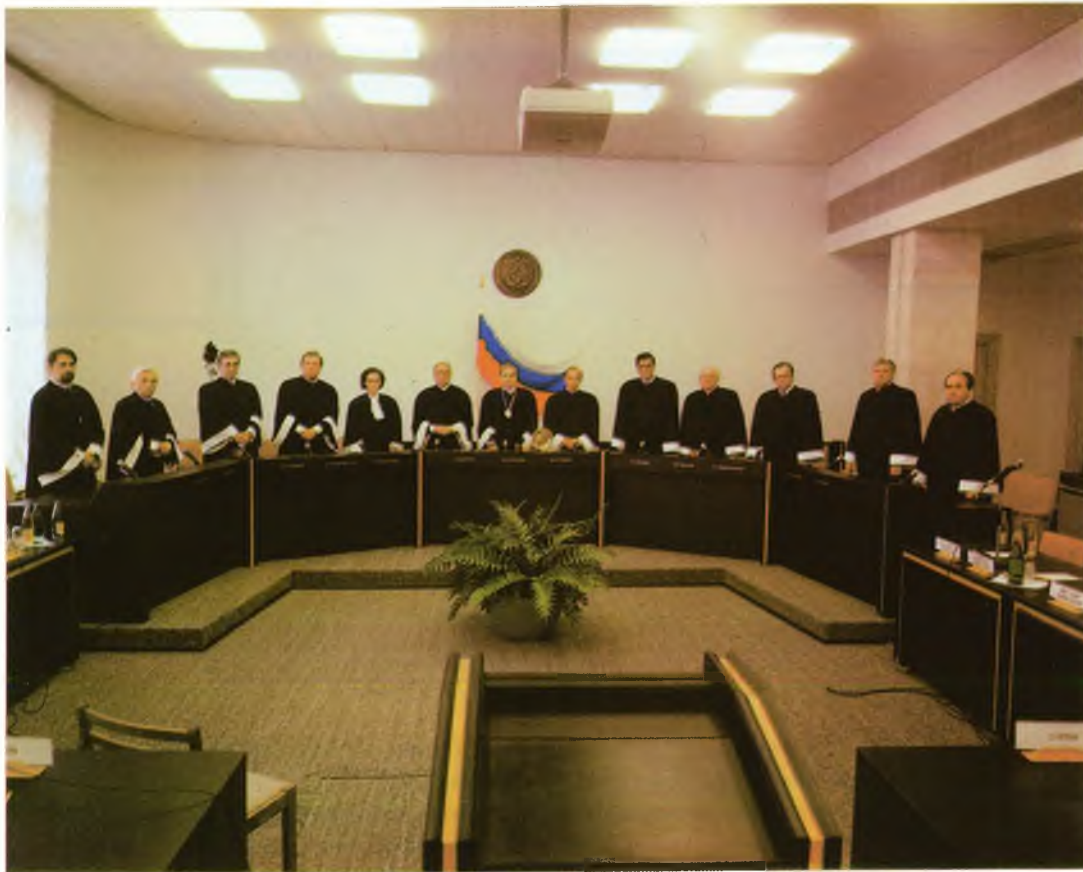
Первый состав Конституционного Суда Российской Федерации в зале судебных заседаний